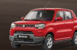
Fire Red (Z4Q)