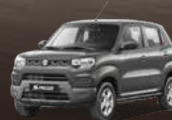
Metallic Granite Grey (ZTN)