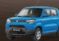
Pearl Starry Blue (ZZS)