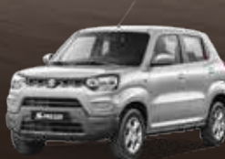
Metallic Silky Silver (Z2S)