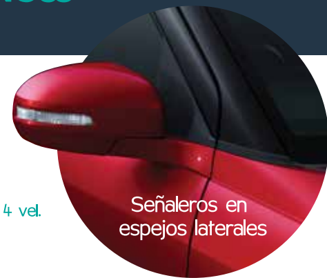
Señaleros en espejos laterales