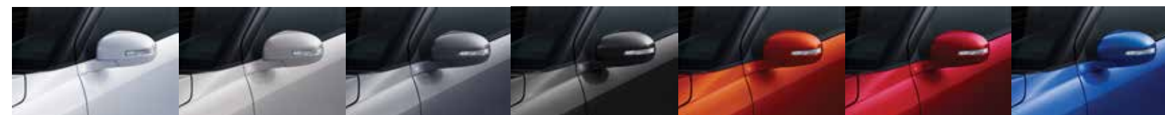
Blanco Perla Plata Metalizado Gris Grafito Negro Metal Terracota Rojo Perlado Azul Claro Perla