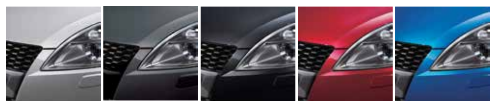
Blanco Perla Plata Premium Negro Perlado Rojo Ablace Perlado Azul Perlado