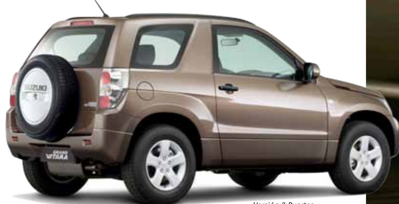
Versión 3 Puertas

GRAND VITARA fusiona tradición y experiencia de la marca SUZUKI en el segmento de los SUV todo terreno.