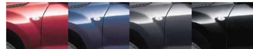
Bordo Azul Gris Oscuro Negro