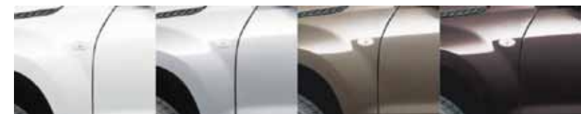
Blanco Plata Bronce Claro Bronce Oscuro